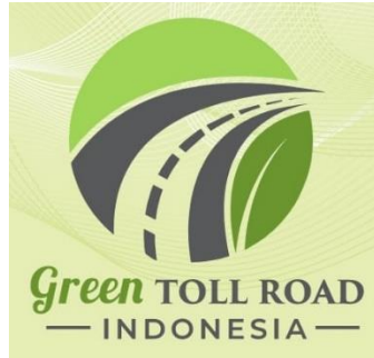
Gambar 1. Logo Green Toll Road Indonesia